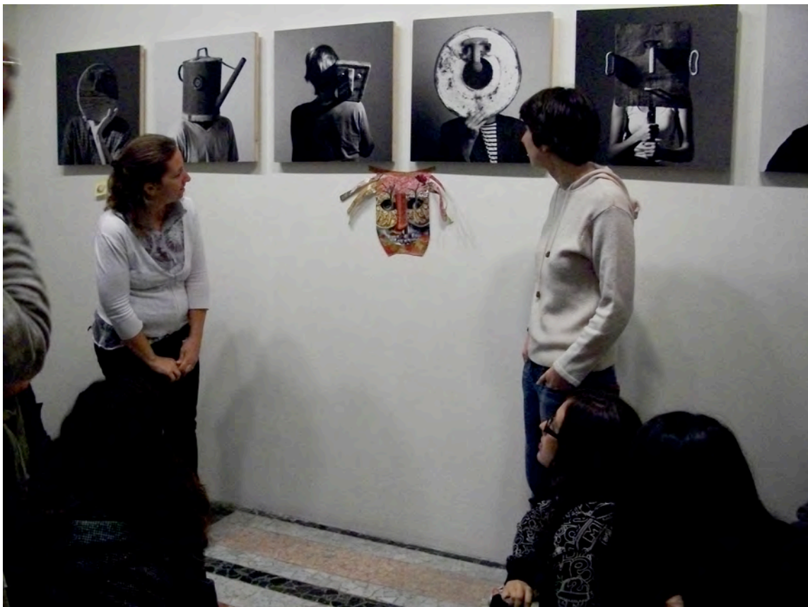
Figura 2. Imagen de relato visual de asistente al taller “Vínculos, Enredos y Relaciones: una aproximación educativa a las obras de Isidro Ferrer” junto a la pieza Doce máscaras para 12 amigos. Una máscara para cada uno de los 12 meses del año (2004) de Isidro Ferrer.

fotografiándolas después. Para dejar claro que esto se trataba de una propuesta de intervención por parte del público y que cualquiera podía participar en ella, en la sala, junto a la bandeja de imágenes se podía leer el siguiente texto: “¿Quieres construir un relato sin palabras? Elige varias imágenes y colócalas en la pared junto a alguna obra de la exposición construyendo una historia sólo con imágenes. Después puedes tomar una foto a tu relato, imprimirla y colocar el resultado en el corcho para que otros visitantes puedan verlo”.