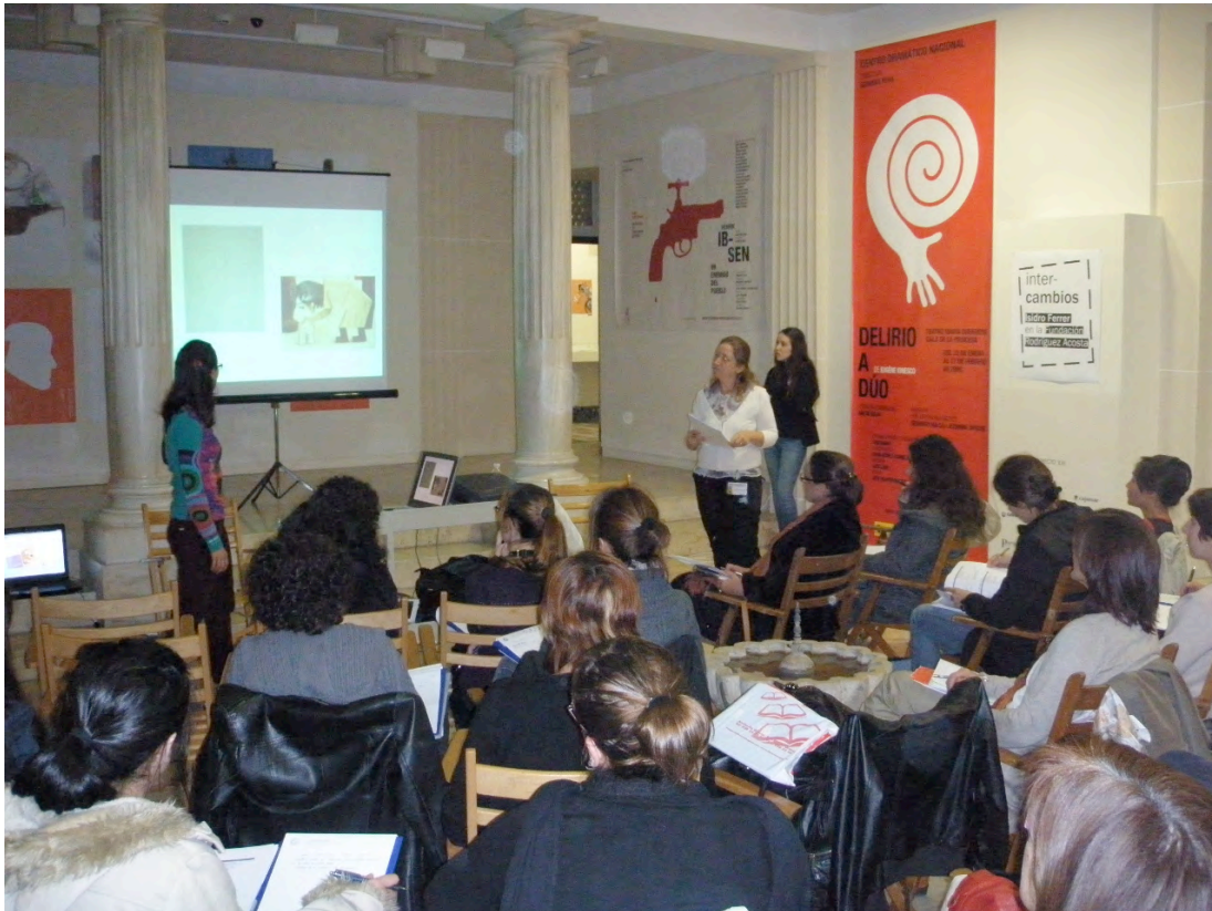
Figura 1. Imagen del taller “Vínculos, Enredos y Relaciones: una aproximación educativa a las obras de Isidro Ferrer”, impartido por Eneritz López y Magalí Kivatinetz en el espacio de la exposición “Intercambios. Isidro Ferrer en la Fundación Rodríguez-Acosta”.