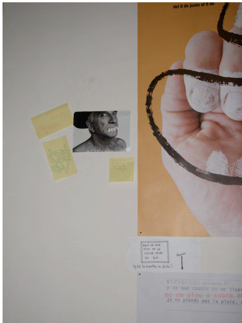
Figura 3. Relato visual y textos elaborados por asistentes al taller “Vínculos, Enredos y Relaciones: una aproximación educativa a las obras de Isidro Ferrer” junto a detalle de cartel de Isidro Ferrer.

explicativo bastante teórico y elevado. Por ello, nuestra segunda dinámica, que consiste en seleccionar una obra y elaborar para ella diferentes tipos de textos (desde frases emotivas hasta complejos relatos), viene motivada por esta necesidad de encontrar en las exposiciones diversas reacciones, explicaciones e interpretaciones escritas bajo diferentes lupas y por personas con intereses y saberes distintos.